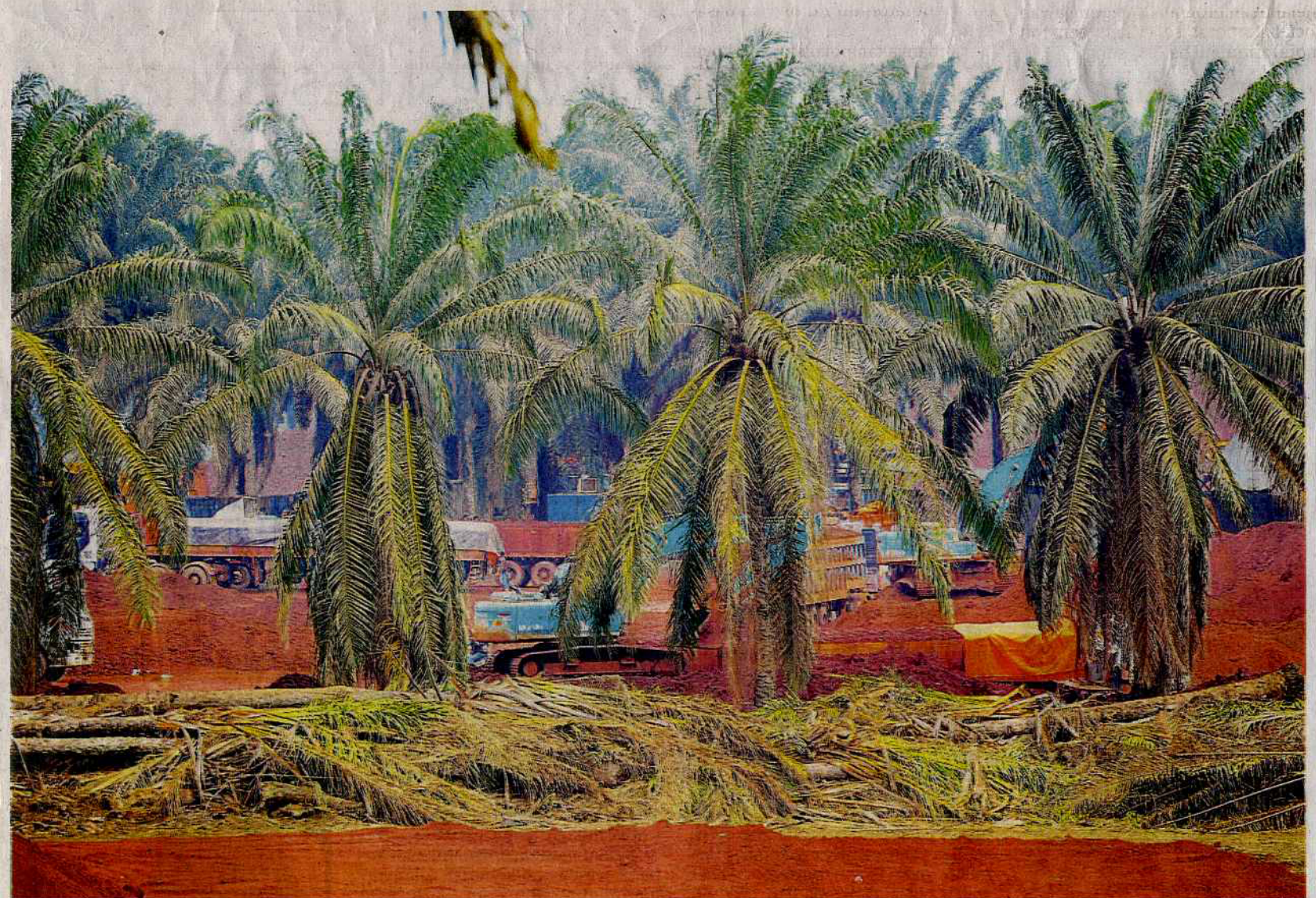
KEGIATAN bauksit di kawasan yang dahulunya berbukit dan ladang kelapa sawit memberi kesan negatif kepada alam sekitar ketika tinjauan Bernama di sekitar Kuantan, semalam.