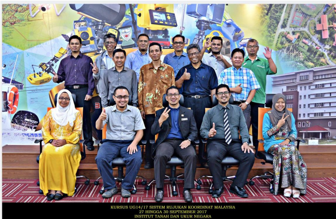
KURSUS UG14/17 SISTEM RUJUKAN KOORDINAT MALAYSIA 27 HINGGA 30 SEPTEMBER 2017 INSTITUT TANAH DAN UKUR NEGARA

Objektif kursus ini adalah memberi pengetahuan dan kefahaman mengenai Sistem Rujukan Koordinat di Malaysia. Di mana antara kandungan kursus adalah pengenalan kepada infrastruktur kawalan Geodetik Malaysia, teori tranformasi dan unjuran peta serta pelaksanaan sistem koordinat GDM 2000.