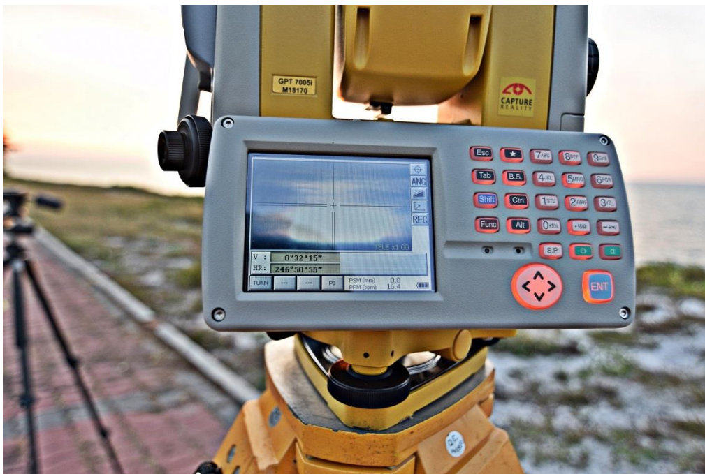
Gambar 3 : Peralatan yang digunakan adalah TopCon IS M18170