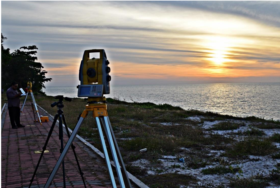
Gambar 2 : Lokasi Pasir Panjang, Langit berawan