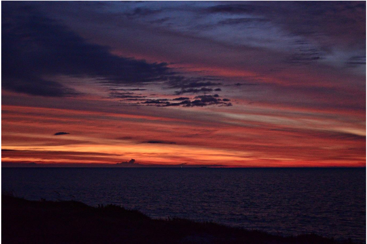
Gambar 6 : Hilal kelihatan seketika jam 19:46, ketika ini tetapi terus tidak kelihatan di liputi awan dan langit merah