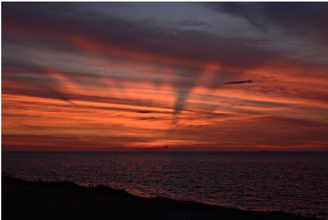
Gambar 5 : Pencarian Hilal bermula dengan langit yang merah