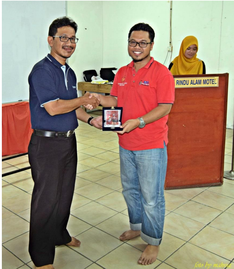
Penutup dan Penghargaan