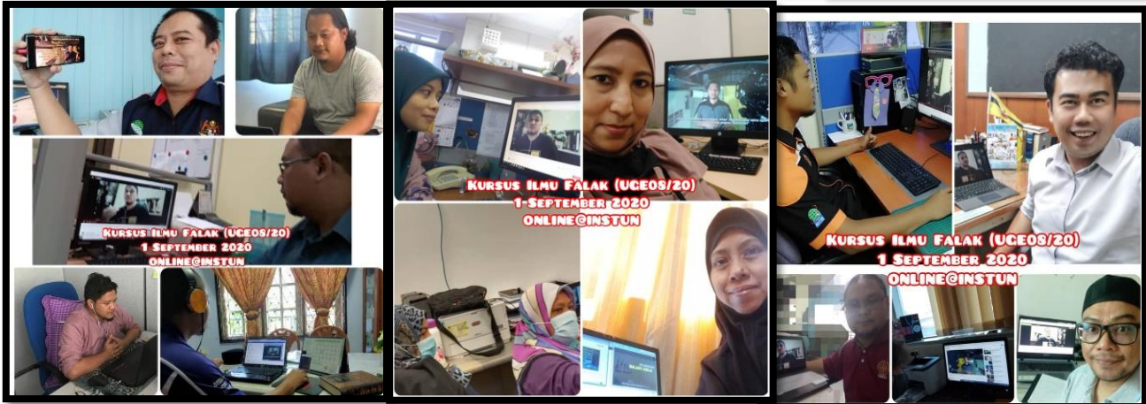
Gambar diatas adalah gambar disebalik tabir pihak Urus Setia kursus dan gambar ihsan daripada peserta kursus yang sedang mengikuti kursus ini. Laporan ringkas dan gambar-gambar lain juga dimuat naik di

Facebook: Bahagian Ukur & Pemetaan, INSTUN