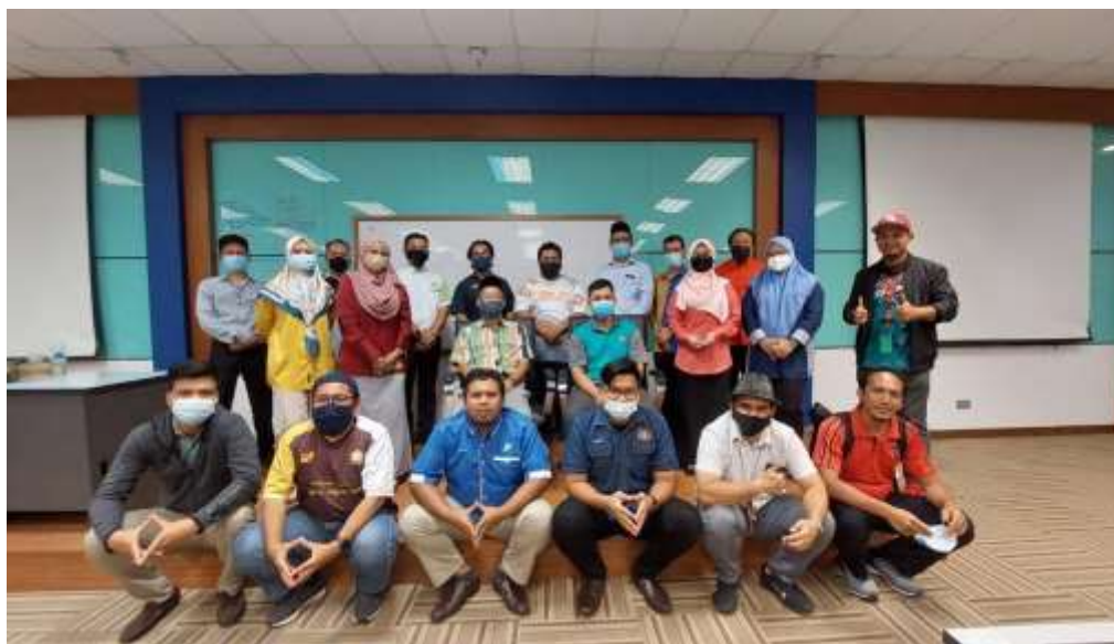
Gambar 11: Barisan urus setia dari Jabatan/ Agensi Kerjasama yang menjayakan SARAS 2021