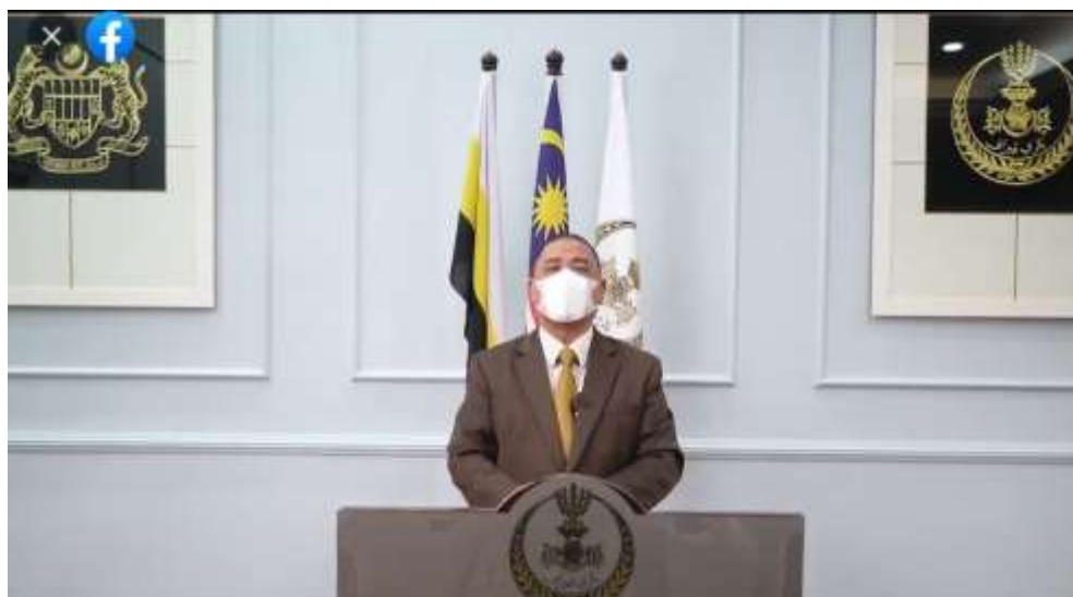
Gambar 6: Penutup SARAS 2021 disempurnakan oleh YAB Dato' Saarani bin Mohamad, Menteri Besar Perak Darul Ridzuan