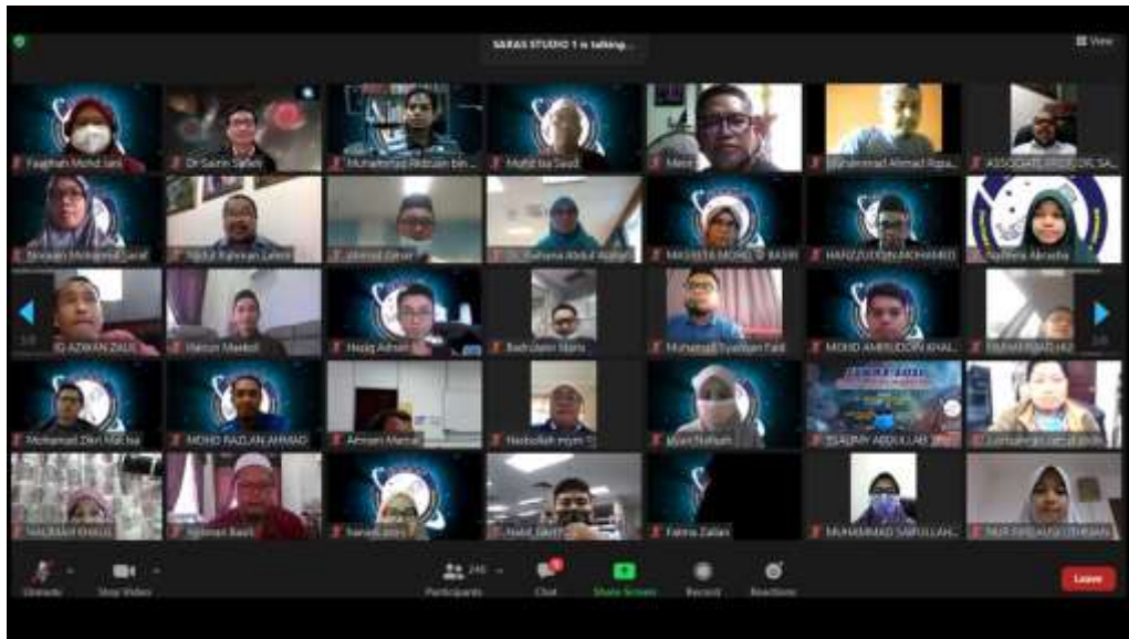
Gambar 1: Penyertaan SARAS yang terdiri daripada peserta pihak Kerajaan, pihak swasta, penyelidik di Institusi Pengajian Tinggi (IPT), pelajar, orang awam yang berminat mendapatkan ilmu dalam bidang falak/ astronomi dan penyertaan daripada MABIMS iaitu Pertemuan Tahunan Tidak Rasmi Menteri-Menteri Agama; Negara Brunei Darussalam, Republik Indonesia, Malaysia dan Republik Singapura