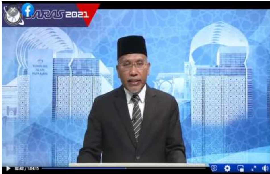
Gambar 5: Perasmian Seminar SARAS dirasmikan oleh YB Senator Tuan Haji Idris bin Ahmad, Menteri di Jabatan Perdana Menteri (Hal Ehwal Agama)