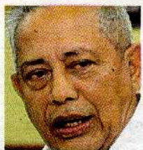
Wan Junaidi Tuanku Jaafar, Menteri Sumber Asli dan Alam Sekitar

Perkara ini (perlombongan bauksit secara haram) memang antara perkara yang kami bimbang apabila kita melaksanakan moratorium”