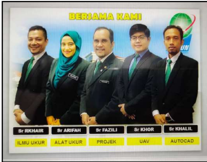
Tenaga Pengajar BUP Yang Menyampaikan Ceramah