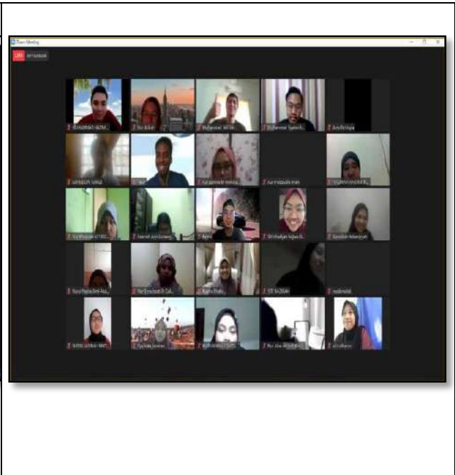
Paparan Program Secara Dalam Talian Yang Dijalankan Melalui Aplikasi Zoom