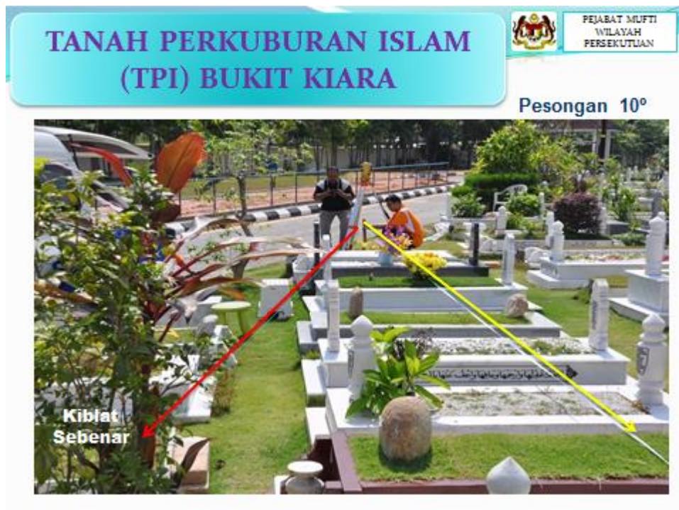
Gambarfoto A : Pesongan Arah Kiblat Di Tanah Perkuburan Islam (TPI) Bukit Kiara